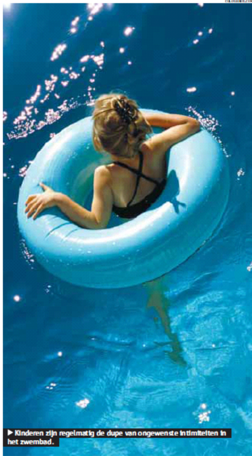
► Kinderen zijn regelmatig de dupe van ongewenste intimiteiten in het zwembad.